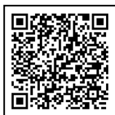
වැඩිදුර දැන ගැනීම සඳහා ස්කෑන් කරන්න

ඕස්ට්‍රේලියාවේ ජෛව ආරක්ෂණ නීති උල්ලංඝනය කළහොත් ඔබට දැඩි දඬුවම්වලට ලක්වීමට සිදු වනු ඇත. ඔබට නීතිය කඩකිරීමේ නිවේදනයක් ලබා දීමට ඉඩ තිබේ. ඔබගේ විසා බලපත්‍රය අවලංගු වීමට ඉඩ ඇති අතර, එසේ වුවහොත් ඔබට ඕස්ට්‍රේලියාවට ඇතුළු වීමට ඉඩ දීම ප්‍රතික්ෂේප කිරීමට සහ අවුරුදු තුනක තහනමකට යටත් කිරීමට ඉඩ තිබේ.